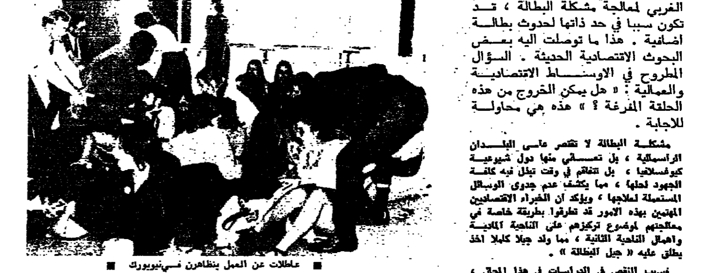
عائلات عن الممل ينظرون نسي نيويورك

الوسائل التي تستعمل حاليا في العالم الغربي لمعالجة مشكلة البطالة، تد تكون سببا في حد ذاتها لحدوث بطالة اضافية، هذا ما توصلت اليه بعض البحوث الاقتصادية الحديثة.